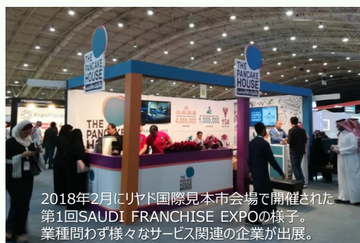
2018年2月にリヤド国際見本市会場で開催された第1回SAUDI FRANCHISE EXPOの様子。業種問わず様々なサービス関連の企業が出展。

※同期間開催中の SAUDI FRANCHISE EXPO 2019 をはじめ現地ショッピングモール、現地中小企業庁などの視察を予定しております。